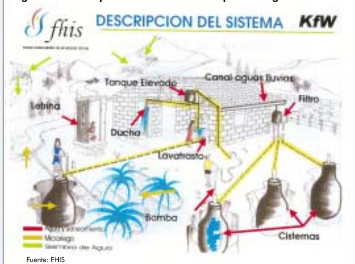
Figura 2: Descripción del sistema de captación aguas lluvias

Tanque elevado: es un tanque de ferro cemento que se instala sobre las vigas de la vivienda. Sirve para almacenar el agua bombeada desde la cisterna y distribuirla por gravedad al lavadero y la ducha. Tiene una capacidad de almacenamiento de 75 litros.