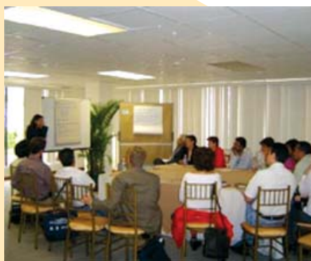
Trabajo en grupo

relacionadas con el tema y otros actores claves que tengan interés en participar. Durante el evento, se dió inicio a la formación de los Grupos de Trabajo. Estos Grupos serán consolidados en eventos a ser organizados en los países. (ver página 8)