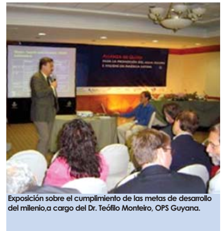
Exposición sobre el cumplimiento de las metas de desarrollo del milenio, a cargo del Dr. Teófilo Monteiro, OPS Guyana.