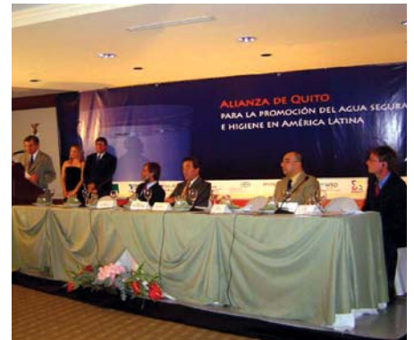
Inauguración del taller a cargo del Dr. Wellington Sandoval, Ministro de Salud Pública del Ecuador, en representación del Señor Presidente de la República del Ecuador.

Para llevar adelante este idea, se acordó la conformación de una "Alianza para la Promoción del Agua Segura e Higiene en América Latina" (Alianza), que permita juntar los esfuerzos de las instituciones que actualmente trabajan en este tema, en ayuda de las miles de familias que necesitan de manera urgente, acceder al agua segura. Como resultado se elaboró la siguiente declaración. 💧