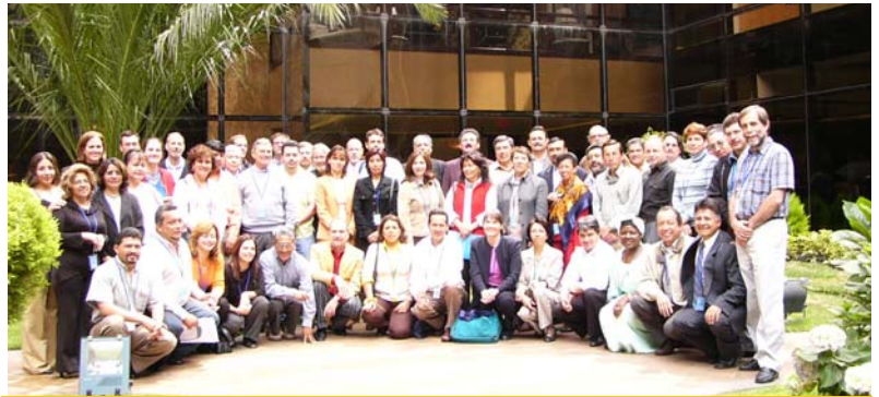
Participantes de la Alianza de Quito 2005.